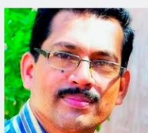
വീരാൻ കുട്ടി Retd. Asst. Professor